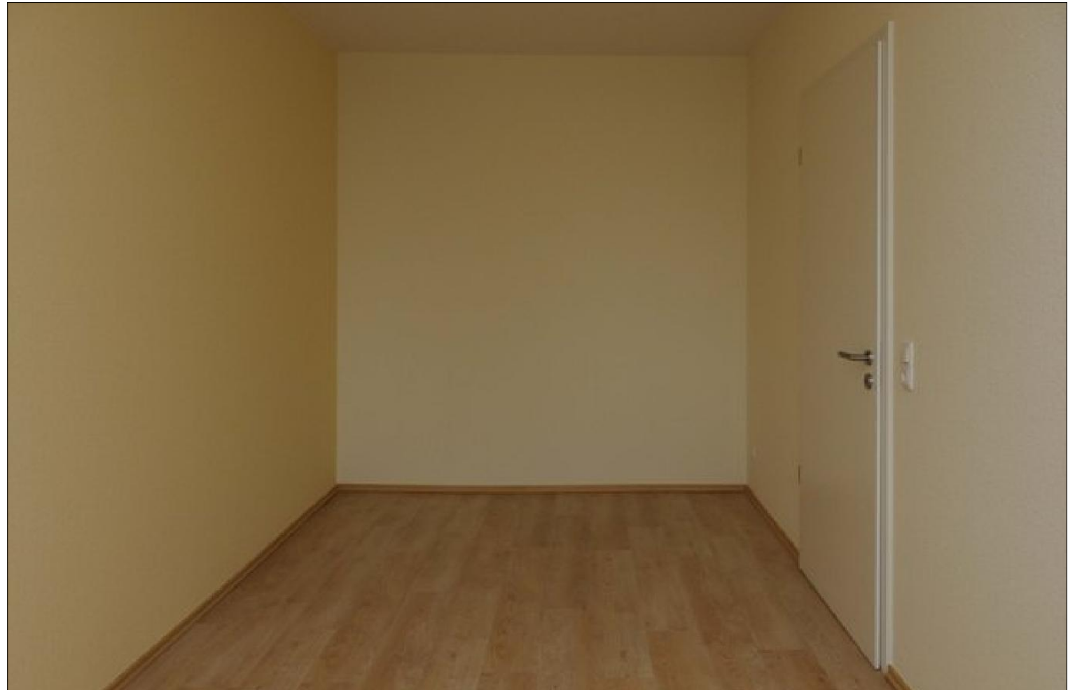
Kinderzimmer 1 Bild

Vermieter: Kleine-Möller Telefon: 03871 21 22 00 eMail: info@nkm-wohnen.de Web: www.nkm-wohnen.de