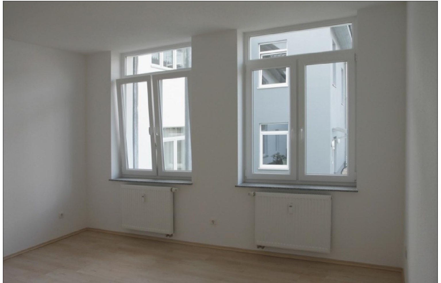
Kinderzimmer 1 Bild

Vermieter: Kleine-Möller Telefon: 03871 21 22 00 eMail: info@nkm-wohnen.de Web: www.nkm-wohnen.de